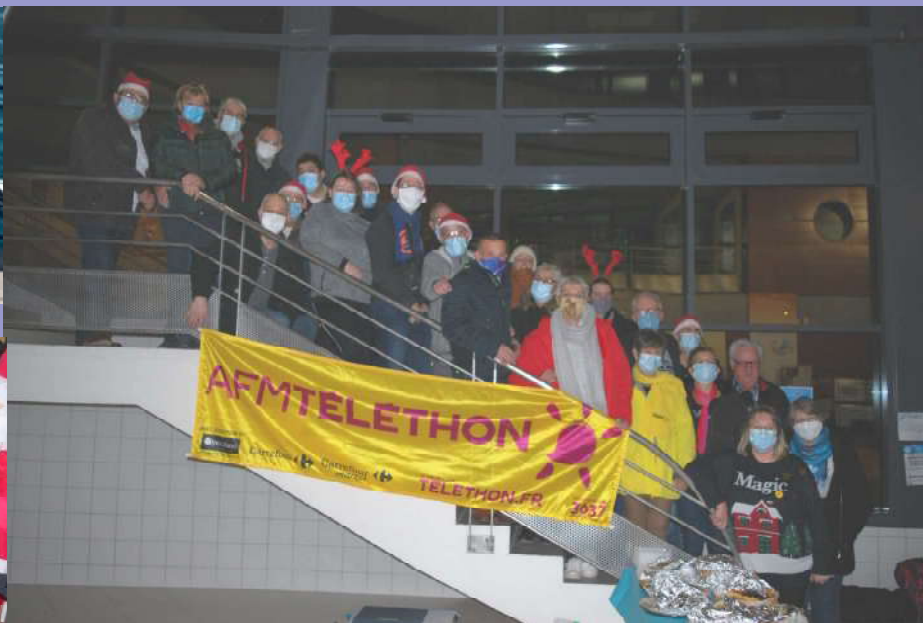
Une belle équipe qui a désiré l'anonymat .... forcé.