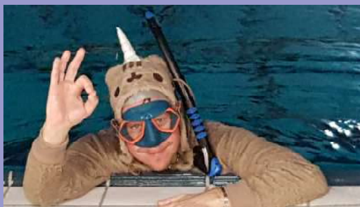
Un narval ou une licorne ? Peut être un JB...

Comme toutes les années cette opération sera renouvelée en décembre prochain avec un très fort accent sur la diffusion de cet événement. Merci à tous pour votre participation qui a ramené la somme de 347.97 euros à l'AMF TELETHON Lidia